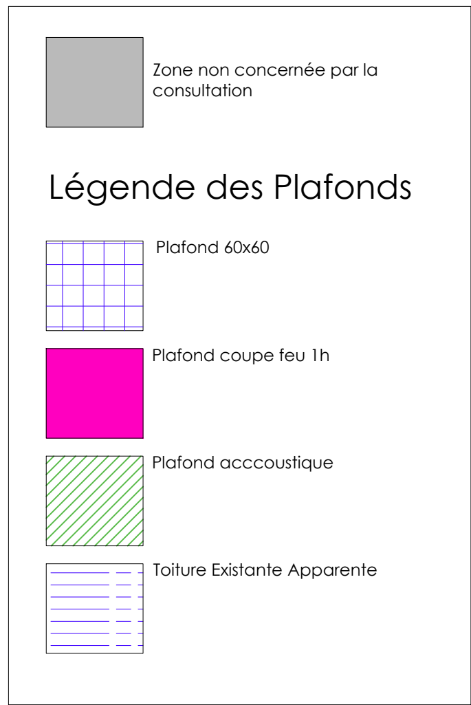
VUE EN PLAN RDC PLAFOND PROJET - 1/150E