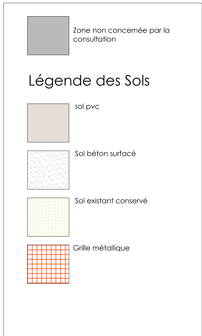
VUE EN PLAN RDC SOLS PROJET - 1/150E