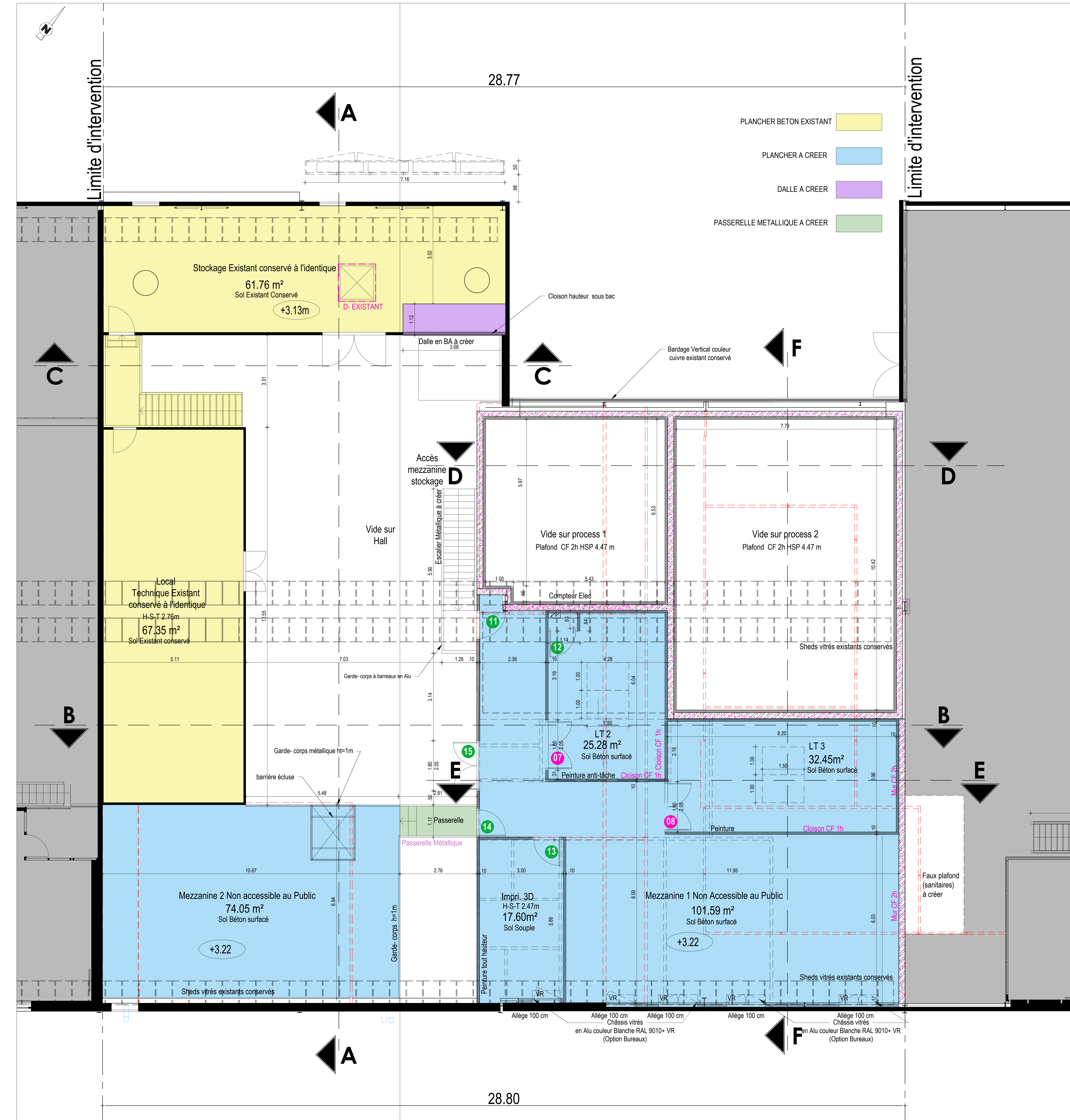
VUE EN PLAN RDC PROJET - 1/50E